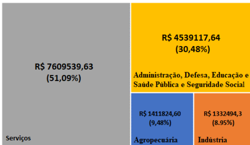
Gráfico 2 – Composição da Atividade Econômica no Município de Cáceres (MT) entre 2010 e 2020 (valores correntes mensurados em moeda nacional)